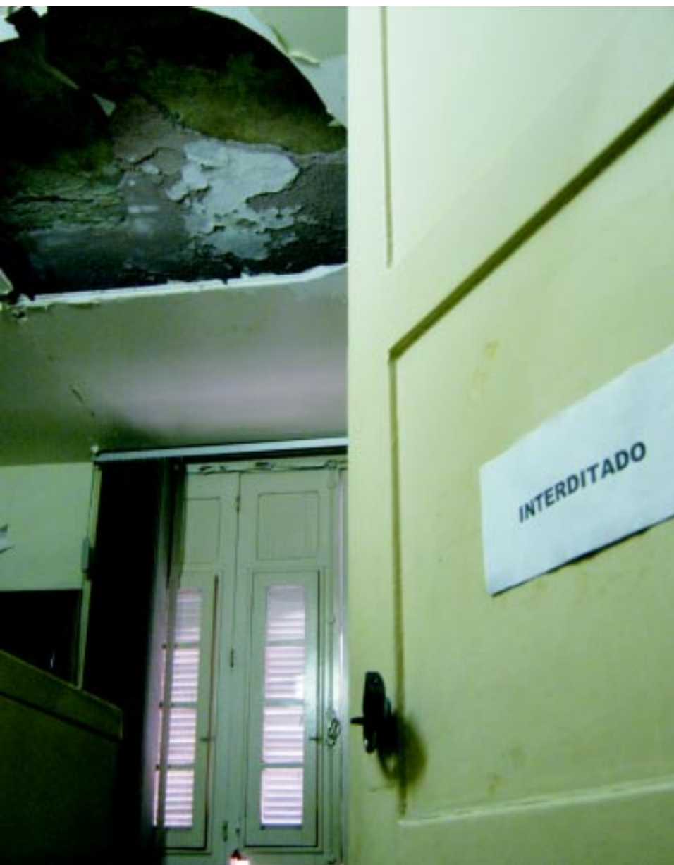
Foto: Parte do teto da sala de atendimento do Pesuerj caiu em dezembro

A UDA está com escassez de espaço físico para atendimentos. Para a coordenadora, "muitas salas estão em condições insalubres". Os locais apresentam infiltrações graves e muitos estão mofados. Além disso, há riscos à própria segurança de quem utiliza o espaço. Diversas placas de reboco têm desabado e provocado o fechamento das salas. Em janeiro, duas delas foram interditadas devido ao problema. No final de 2009, parte do teto desabou sobre uma mesa. Nos três episódios, por sorte, ninguém se feriu.