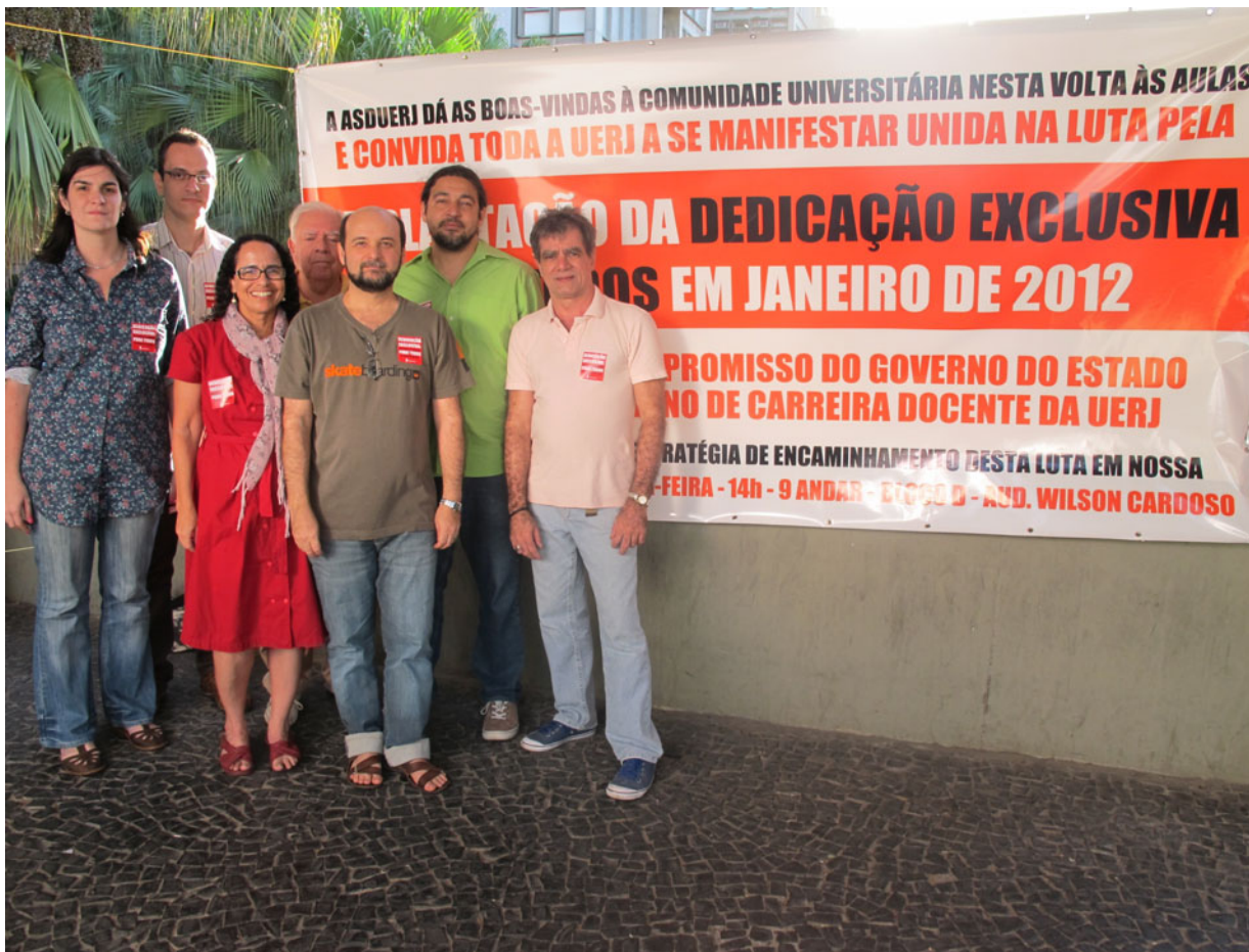
Nova diretoria da Asduerj dará continuidade à luta pela implantação na Uerj do regime de trabalho em Dedicção Exclusiva em janeiro de 2012.

Esta convicção é muito importante ser reafirmada no momento em que a universidade passa pelo seu sexto período eleitoral, desde que os movimentos de professores, alunos e técnico-administrativos organizados conquistaram o direito a escolher seus dirigentes pelo voto direto da comunidade. Este porém com a novidade do estatuto da reeleição para cargos executivos. O que sempre traz consigo o