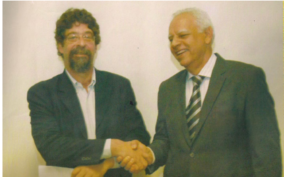
CHAPA 20 - VIEIRALVES E VOLPATO

O processo que culminou na aprovação do Plano de Carreira Docente, em dezembro de 2008, foi um dos mais traumáticos vividos pela universidade nos últimos anos, expresso de forma paradigmática na divisão de sua comunidade no momento da votação da Lei 5.343 na Alerj.