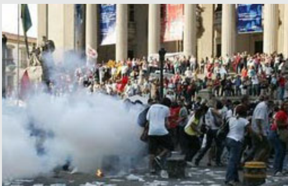
Professores da Rede Estadual de Ensino foram “recebidos” com bomba de gás pela polícia do governo do Rio.

NO QUINTO ANO DE SERGIO CABRAL COMO CHEFE DO PODER EXECUTIVO ESTADUAL, A EDUCAÇÃO PÚBLICA DO ESTADO ATRAVESSA UM DOS PIORES MOMENTOS DE SUA HISTÓRIA.